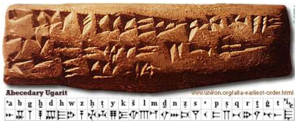
Najstarší známy nápis vo fenickom abecednom písme, 1400-1200 pr.n.l. 20

Tak vedľa seba existovali a existujú kultúry, ktoré hromadia znaky a kultúry, ktorých príslušníkom stačí osvojiť si len pár znakov na porozumenie celej písanej literatúre. Vývoj sa prudko urýchľuje – čo je prípad Európy.