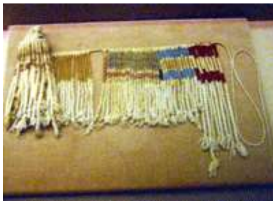
Uzlové písmo kipu u Inkov 18

Kultúra písanej knihy pre mnohých kresťanov znamená, že Európa je kultúrou Biblie. Sčasti to platí, avšak písaná kniha je ne tomto kontinente zakorenená omnoho hlbšie: Mnohé kultúry sveta sa formovali s pomocou písma a písaných dokumentov, dokonca iba ojedinelé kultúry si nevytvorili vlastné písmo, ako napr. Inkovia v Peru, pre ktorých tzv. uzlové písmo bolo len praktickou pomôckou pre zápis dát, ale nie písmom.