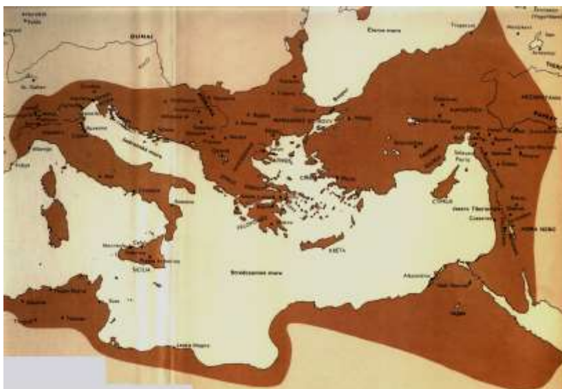
Najväčší rozmach Byzantskej ríše za vlády Justiniána, r. 565. 6

Prečo sa islam nepovažuje za súčasť európskej kultúry, keď bol súčasťou balkánskych a španielskych dejín a je dodnes masívne prítomný na Balkáne, v Paríži či Holandsku? Akou kultúrou je anglofónna kultúra Austrálie? Ako je možné, že Aurelius Augustín pochádzal z Afriky, bol biskupom v Afrike, ale považuje sa za jedného zo zakladateľov európskej kresťanskej filozofie a teológie?