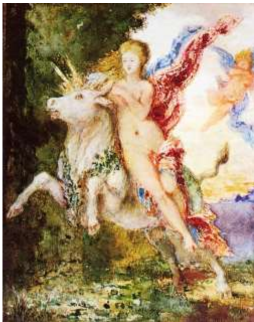
Gustav Moreau (1826-1898) – Európa a býk

V celej európskej histórii bola vlastne len jediná „skutočná“ Európa: krásna dcéra sidónskeho kráľa Adenóra, ktorú uniesol Zeus 4 . Túto mytologickú Európu však môžeme odbaviť tým, že nebola reálna, ale vznikla len vo fantázii antických Grékov – a už nemáme žiadnu skutočnú Európu.