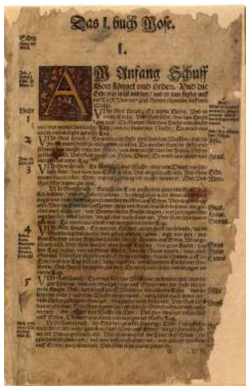
Lutherov preklad prvých riadkov Biblie, Wittenberg 1555 16

Luther potvrdil učenie o predurčení ľudského osudu – ľudský osud bol definitívne určený pri stvorení a pri narodení, veď akoby mohol slabý človečik konkurovať nekonečnej moci a nekončenému vedomiu Boha a snažiť sa zmeniť Božiu vôľu tým, že by sa samostatne snažil o spásu napriek Božej vôli.