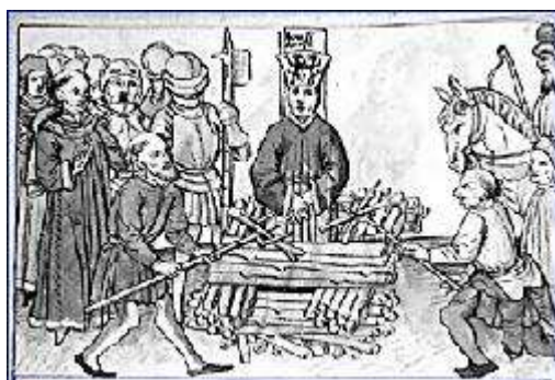
Upaľovanie kacíra 7

Európa obľubuje moc, pachtí sa po nej a s chuťou ju využíva. Centralizácia kráľovskej moci, moci veľkých kláštorov (napr. Cluny), centralizácia pápežskej moci, rôzne fašizoidné snahy v 20. storočí, narastanie štátneho dirigizmu v posledných desaťročiach, centralizácia moci Bruselu najprv pomocou tzv. Ústavy pre Európu a následne malým podvodom – premenovaním ústavy na Lisabonskú zmluvu – to sú nekončiace a opakujúce sa snahy sústrediť moc do čo najmenšieho počtu inštitúcií a politikov.