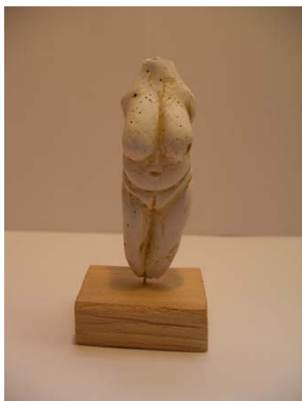
Tzv. Venuša z Moravian z obdobia cca 20 000 rokov pr. n. l.

Máme pred sebou dve paleolitické a tri staroveké ženské postavy